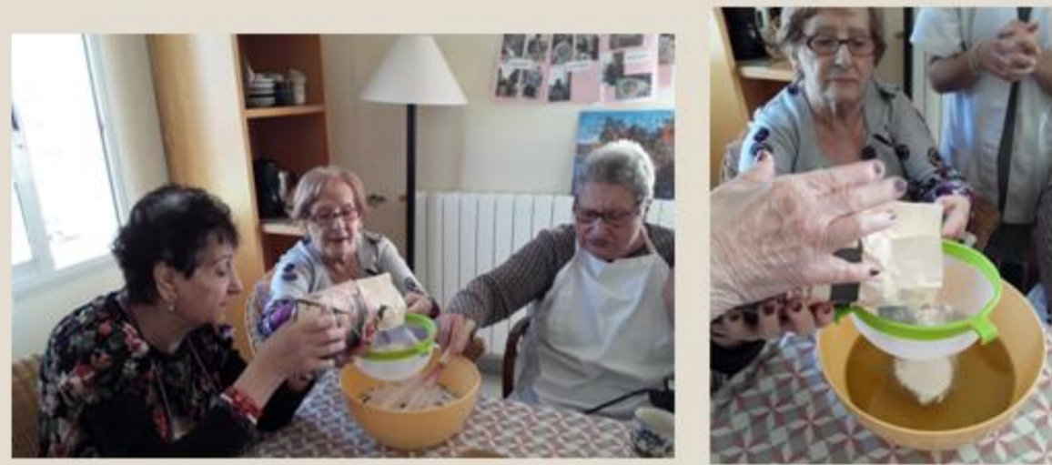
Exemple de suport gràfic (Power Point) utilitzat durant les explicacions de les receptes a l'escola.

5. Añadir 1 kg de harina. Es importante tamizar la harina.