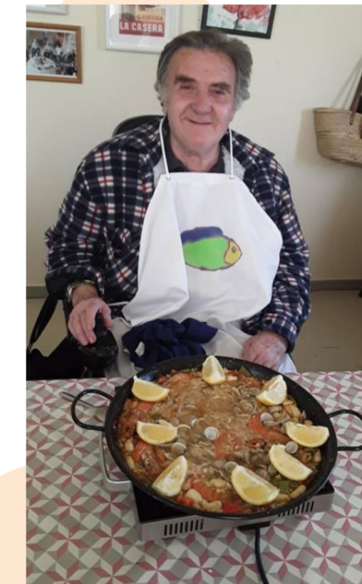
Fotografies del grup de cuina i de la sessió intergeneracional a l'escola.